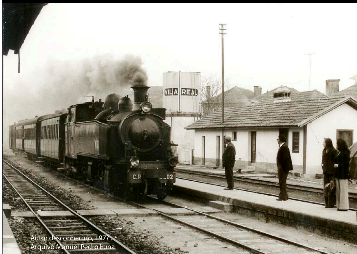
Autor desconhecido, 1977. Arquivo Manuel Pedro Luna