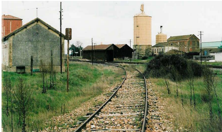
Fotografia 1: Início da Linha de La Fregeneda (bifurcação junto da estação de La Fuente de San Esteban)