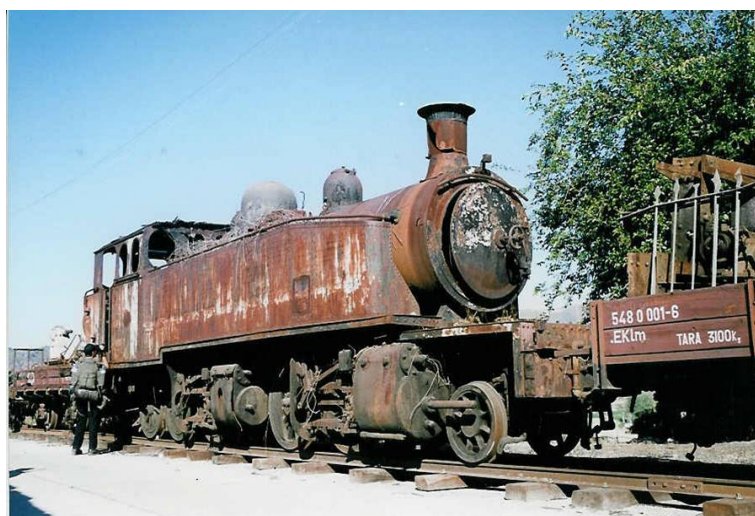
Fotografia 6: Antiga locomotiva a vapor abandonada na estação do Pocinho