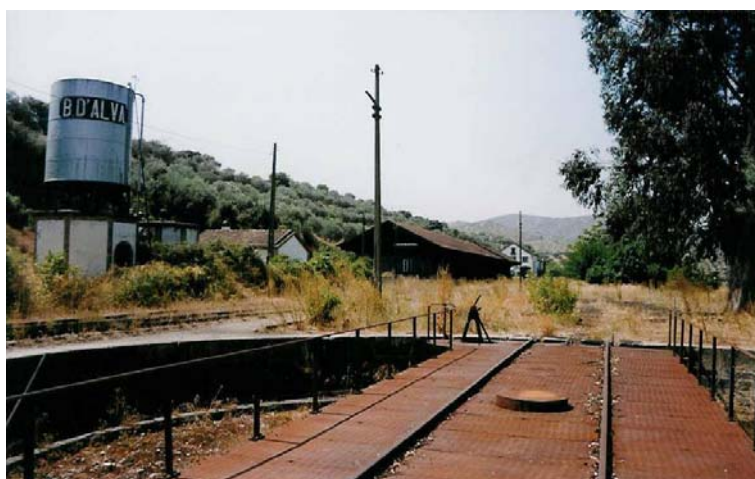
Fotografia 5: Estação da Barca d'Alva (placa giratória em primeiro plano)