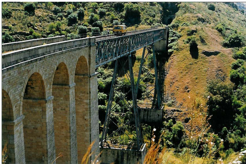
Fotografia 3: Ponte do Arroyo del Lugar (as "troneiras" na base de pedra dos pilares metálicos)